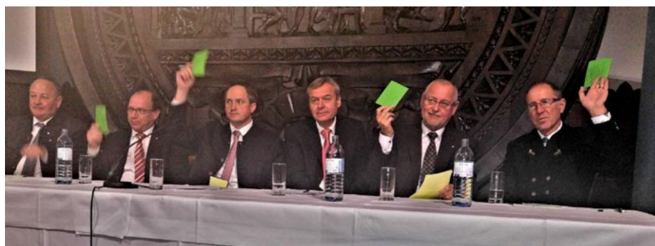
Obr. 1: Předsednictvo valné hromady Svazu vinařů Rakouska při hlasování

Na valné hromadě delegáti schválili jednání svazu v minulém roce, financování a hlavně zvolili předsedu a představenstvo pro příští volební období bez zásadních změn. Hodnotili i výnos hroz-